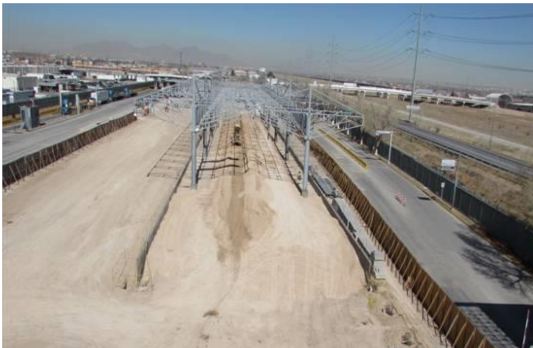
Plataforma de Importación