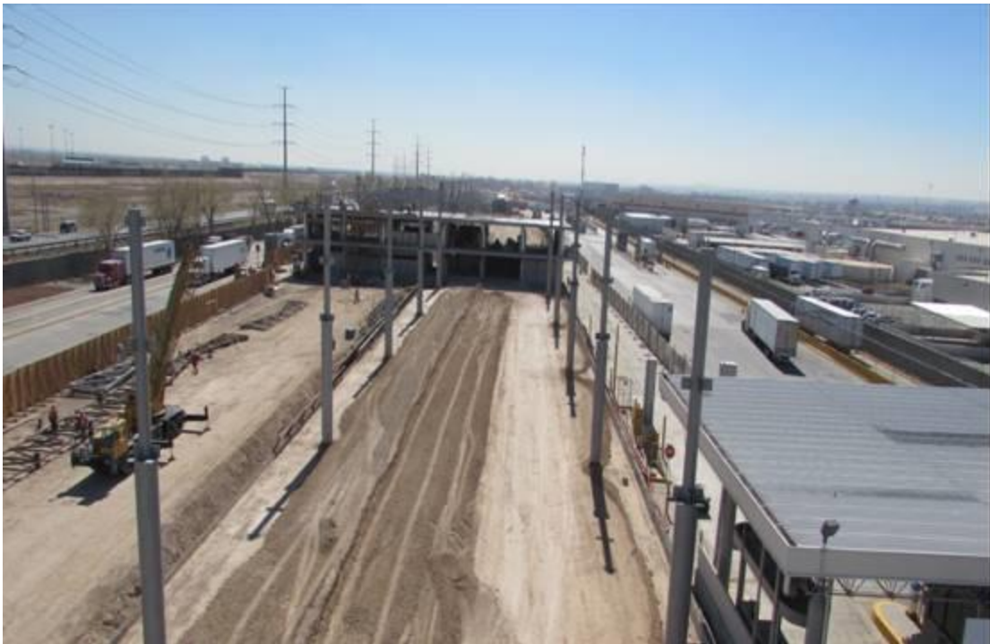
Plataforma de Exportación y Edificio de Primer Reconocimiento