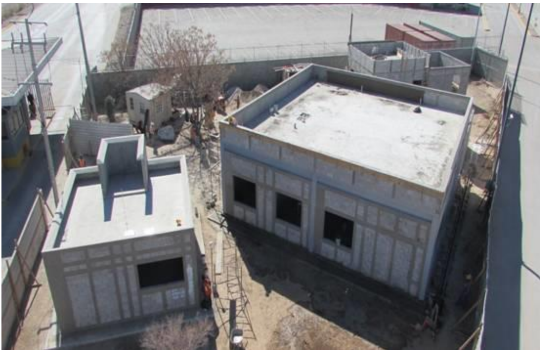
Cuarto de Control de Módulos, Edificio de Personal Operativo y Unidad Canina

En relación a los trabajos del Reordenamiento Integral de la Aduana de Ciudad Juárez, se hace de su conocimiento que la cuarta semana del mes de marzo del presente (23 de marzo) dará inicio a la segunda etapa de la obra, la cual comprende la demolición de los módulos actuales, construcción de nuevos módulos (3 de importación y 2 de exportación), así como el cierre de los carriles y la construcción de la carpeta de concreto hidráulico de la ruta fiscal.